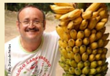
Projeto Agro Vale do Suruí - Magé