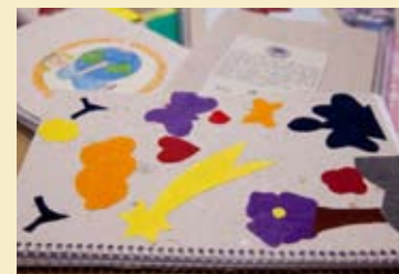
Projeto Ciclo Reciclar - Mairiporã