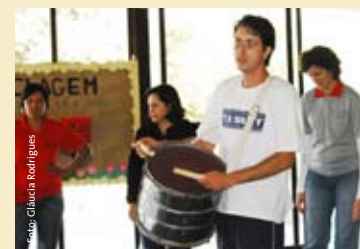
Projeto Agenda Cultural & Arte Educação - Pedro Leopoldo