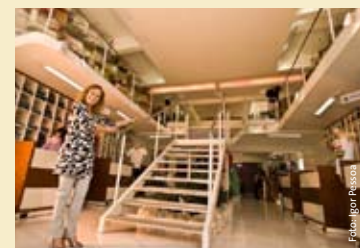
Projeto Rumo Certo - Barroso

Para mais informações, acesse www.institutoholcim.org ou entre em contato com: