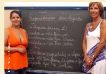
Projeto Educando Verde - Cantagalo