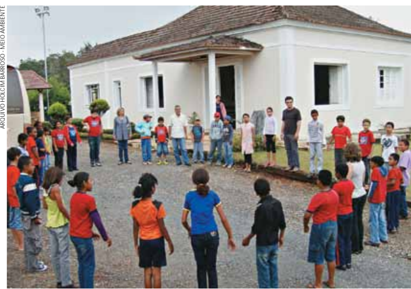
ARQUIVO HOLCIM BARROSO - MEIO AMBIENTE